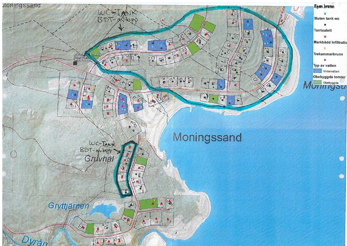
Figur 1 Kartan är framtagen år 2015 i samarbete mellan Plan- och byggkontoret och Norrhälsinge miljökontor. Kartan beskriver hur de olika fastigheterna löst vatten- och avlopp inom området.