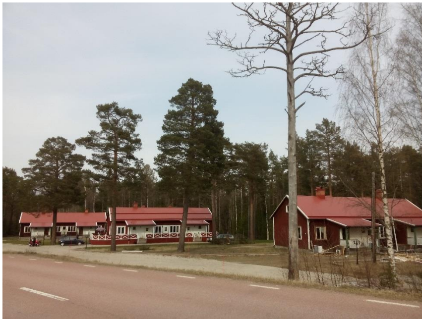
Den enhetliga utformningen av de tre huslängorna på Vikarskogen 1:28 är karaktärsskapande och bidrar till bruksarbetarbostädernas kulturhistoriska värde.

Byggnaderna på området har ett visst kulturhistoriskt värde som bruksarbetarbostäder. Vid planläggning ska byggnadsverk utformas på ett sätt som är lämpligt med hänsyn till stads- och landskapsbilden samt kulturvärdena på platsen. Ändringar och tillägg i bebyggelsen ska göras varsamt så att befintliga karaktärsdrag respekteras och tillvaratas enligt plan- och bygglagen. Byggnaderna och de yttre detaljerna får inte ändras så att husens karaktär förvanskas. De karaktärsskapande uterummen och fasadmaterialet av rödmålat trä med vita och gröna detaljer, ska bibehållas. Rivning eller förändring av husens yttre kräver bygglov.