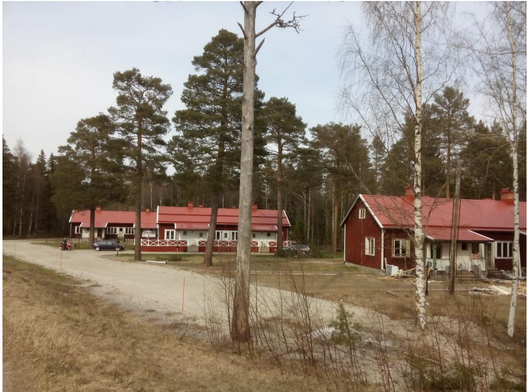
Vikarskogen 1:28, våren 2015

Ägaren till fastigheten Vikarskogen 1:28 har sökt om planbesked för att ändra användningsreglerna för fastighetens byggnader. Syftet med denna detaljplan är att medge att byggnaderna får användas för bostadsändamål såväl kontorsverksamhet och till att ange varsamhetsbestämmelser.