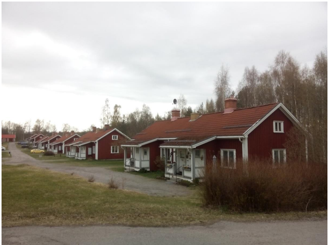
Referensbild på liknande bruksarbetarbostäder i Ljusne, 2015.

Inom planområdet finns inga andra kulturhistoriska lämningar. Närmsta fornlämningar i närområdet ligger på andra sidan om Sågvägen, cirka 80 meter sydväst om fastigheten. Här återfinns gravar från bronsåldern och järnåldern i form av rösen och stensättningar.